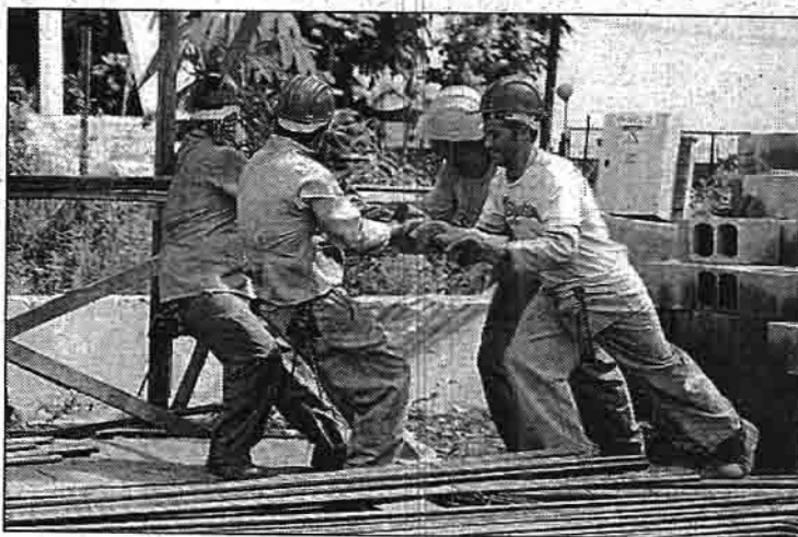
O desemprego oculto ficou estável, segundo a pesquisa

reiro sofreu redução de 0,9% devido à perda de postos de trabalho principalmente nos setores da indústria de transformação, construção e, em menor grau, no de serviços e no comércio.