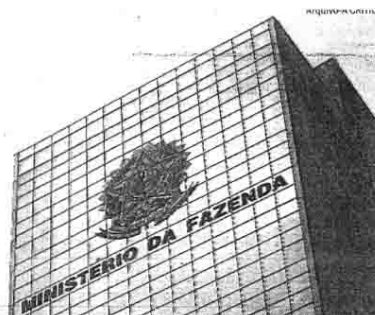
Delegacia da Receita Federal em Manaus continua arrecadando muito

O valor obtido pela Delegacia em Manaus representou em fevereiro quase a metade do total arrecadado na 2ª Região Fiscal (equivalente à Região Norte excluindo-se o estado de Tocantins). Foram 42,15% de participação. Comparativamente, a arrecadação da 2ª Região Fiscal, foi 18,28% maior em valores nominais, e 11,26% maior, quando